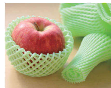
■フルーツキャップ